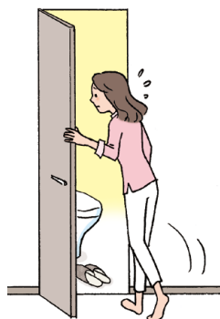
何回もトイレに行く

この他にも、体調に変化があった場合や気になることがありましたら、医師や薬剤師にご相談ください。