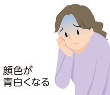
顔色が 青白くなる