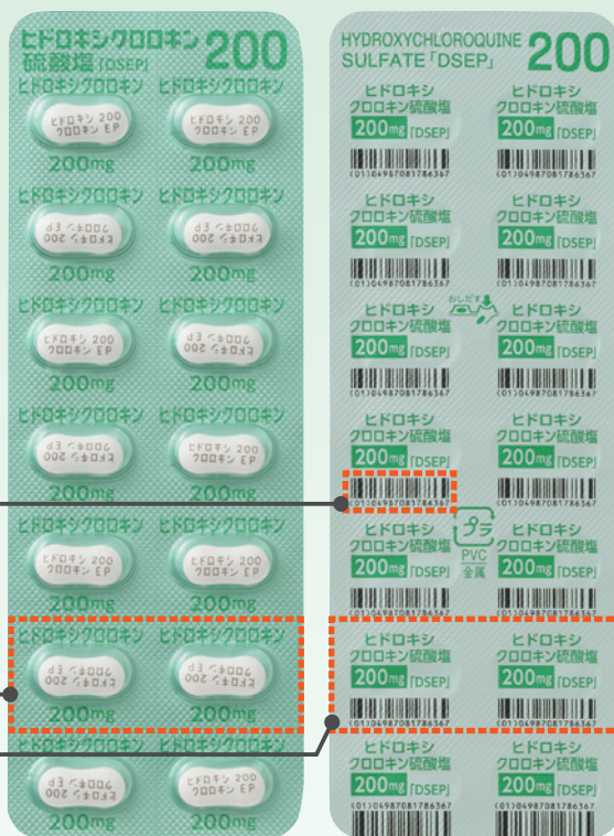
錠200mg [PTP 14錠シート] L: 124.0mm × W: 44.0mm