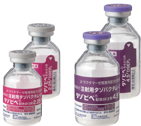
2.25g(瓶) 高さ:54mm、瓶底の直径:32mm 4.5g(瓶) 高さ:68mm、瓶底の直径:36mm