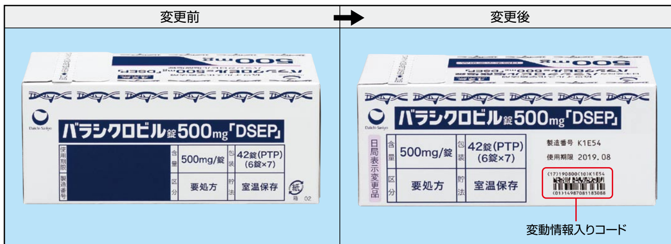
変動情報入りコード